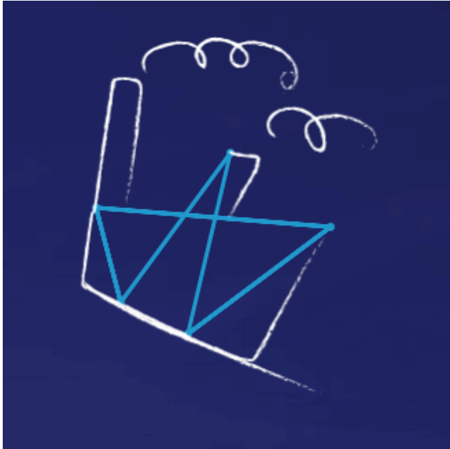
Grupa Enea została nowym właścicielem Elektrowni Połaniec

młodym, ambitnym studentom i absolwentom, którym zależy na zdobyciu unikalnego doświadczenia branżowego i rozwoju swoich umiejętności w obszarach biznesowych (m.in. techniczno-operacyjnym, administracyjno-prawnym, finansowo-księgowym, HR, IT oraz tradingowym). Po zakończeniu pierwszej edycji Zainstaluj się w Enei 70% stażystów otrzymało propozycję pracy w naszej Grupie. W kolejnej, drugiej edycji programu wzięło udział kolejnych 16 stażystów i praktykantów.